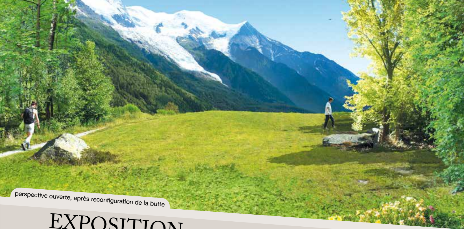
perspective ouverte, après reconfiguration de la butte