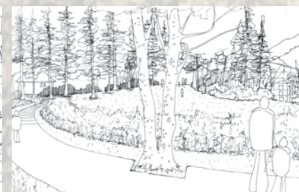
tracé d'un futur « chemin du Couttet »