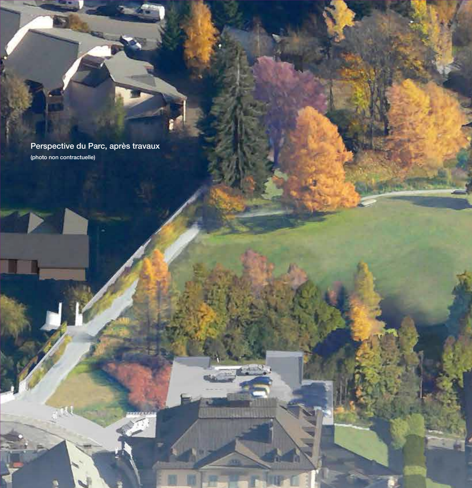
Perspective du Parc, après travaux