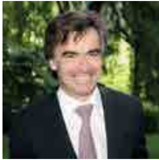
Éric Fournier Maire de Chamonix Président de la Communauté de Communes Vallée de Chamonix