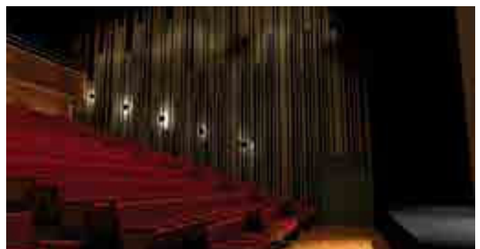
Préfigurations 3D de la nouvelle salle