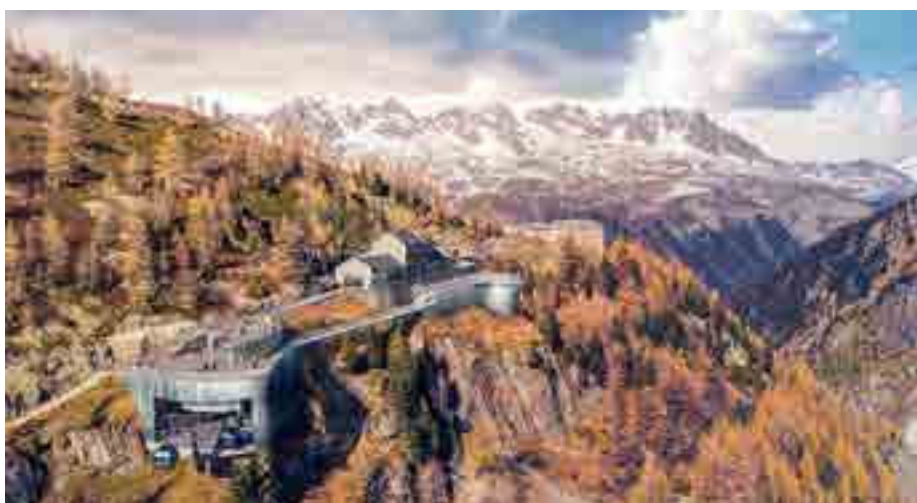
Préfiguration Gare Amont du Montenvers et Glaciorium

La CMB est en charge du programme de création de trois gares (aval, intermédiaire et amont) et a déjà retenu le prestigieux cabinet d'architecture Renzo Piano (Beaubourg, Pont de Génès, Musée Klee à Berne...) pour les réaliser. La commune, quant à elle, en charge de l'aménagement du territoire, travaille sur les abords, les parkings et la nécessaire liaison de l'installation avec le centre du village d'Argentière. Un groupe de travail spécifique piloté par la commune a été mis en place pour assurer la conduite générale du projet et organiser l'articulation entre les missions des différents partenaires de cet ambitieux chantier. Les élus souhaitent que ce soit désormais le cas pour l'ensemble des réalisations futures.