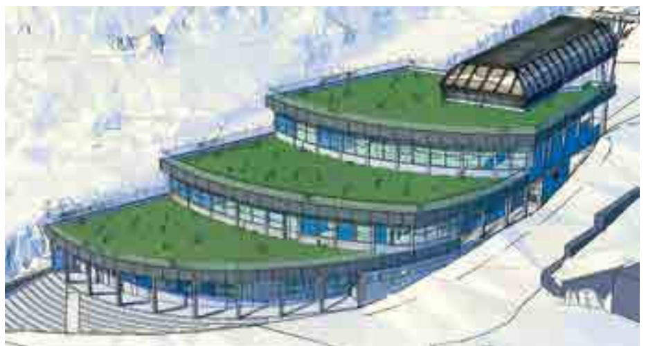
Préfiguration TC Charamillon Gare Aval