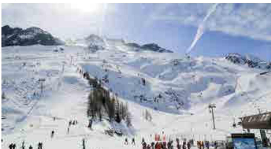
Lognan - Les Grands Montets