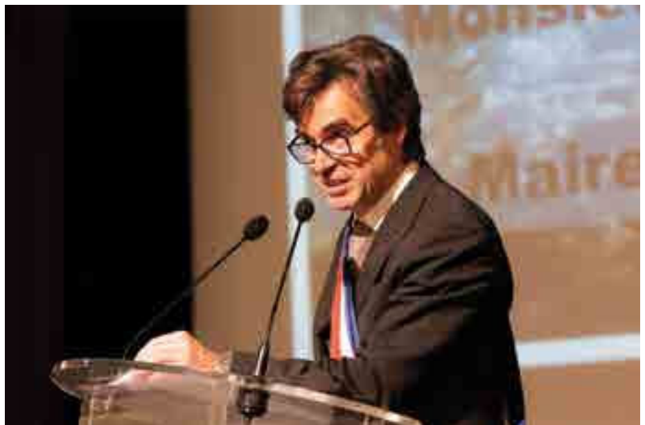
Éric Fournier